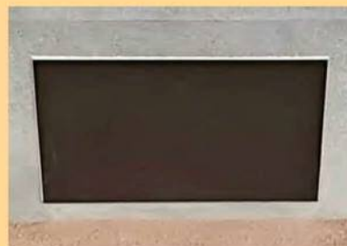
浸水時(止水シート取付)