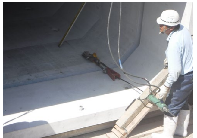
■油圧ジャッキによる引寄せ