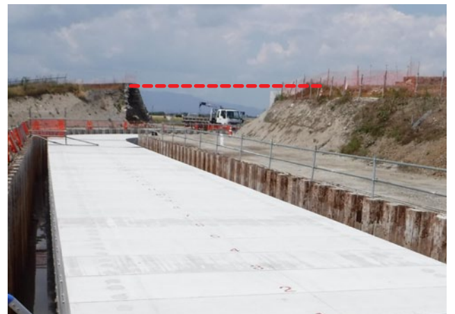
■堤防横断部（※赤線：堤防築造ライン）